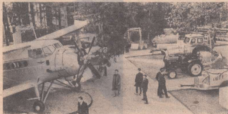
Москва. Международная выставка «Химия в промышленности, строительстве и сельском хозяйстве» в парке культуры и отдыха «Сокольники».

На снимке: на открытой площадке павильона СССР вы видите машины, используемые в сельском хозяйстве. Справа представлена целая серия опрыскивателей — садовый, виноградниковый и другие. Слева — самолет «АН-2», который используется для химической обработки посевов. Он может поднять 1.500 кг. химикатов, перевозить почту, грузы и производить другие работы.